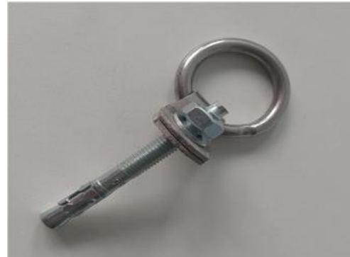
Anello con tassello 10x90 mm

Il chiodo autocostruito con materiale di seconda qualità, che si riconosce da una saldatura più grossolana e meno rifinita, è comunque meno utilizzato nelle vie.