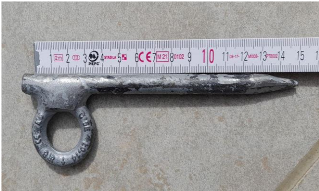
Chiodo autocostruito di "prima qualità"