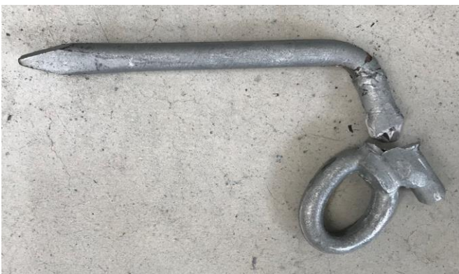
Il chiodo rotto

Al contrario, il nostro chiodo autocostruito con acciaio da carpenterie di prima qualità , quello più utilizzato nelle nostre salite, non si è rotto come dimostrato nei precedenti test.