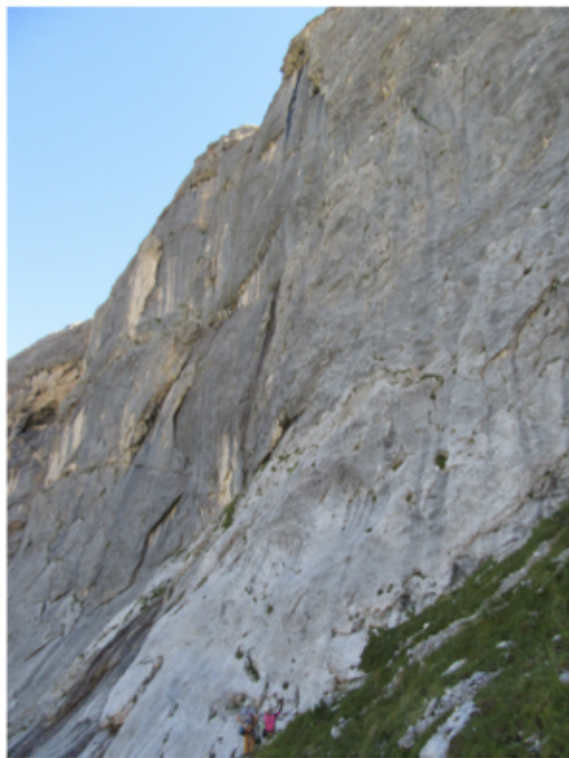
La via comincia sulle placche compatte, si sviluppa nel grande diedro nel centro e esce a sinistra del grande tetto.